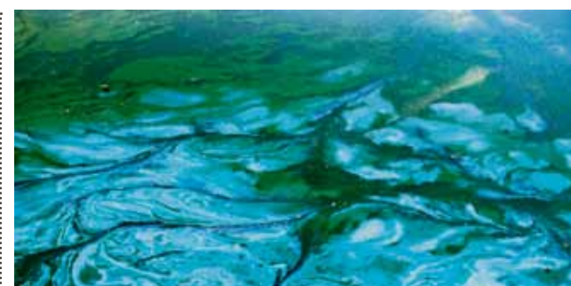
Grote hoeveelheid van de cyanobacterie.

Voordat de nanobuisjes in het papier worden geïmpregneerd, worden ze gemengd met antistoffen voor microcystin. Wanneer het papier in contact komt met water, binden de antistoffen zich met de microcystinbacterie. Dat heeft tot gevolg dat de ruimte tussen de nanobuisjes groter wordt, waardoor de geleiding vermindert. Een externe monitor meet de veranderingen in het geleidend vermogen. Door andere antistof-