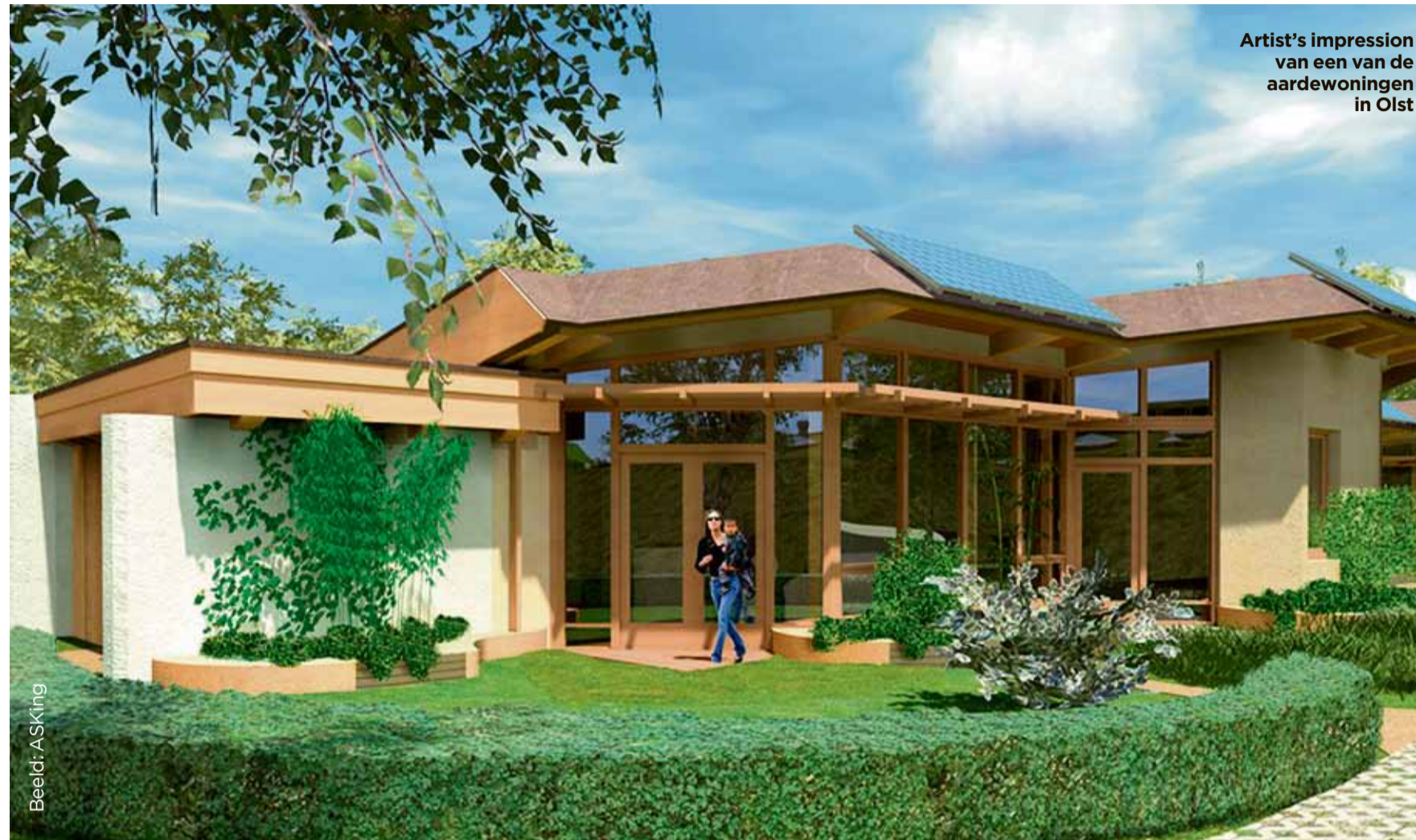
Artist's impression van een van de aardewoningen in Olst

De nieuwe wijk is onderdeel van het nieuwbouwproject Zonnekamp Oost in Olst, dat afgelopen december is uitgeroepen tot duurzaamste dorp van Overijssel. In de huidige opzet leggen bewo-