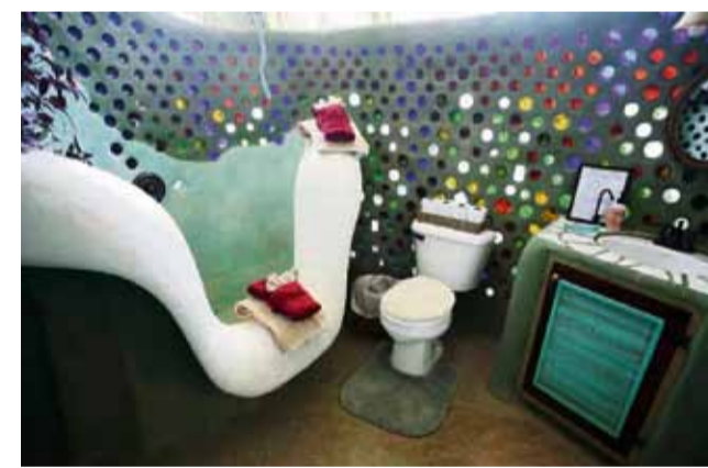
Boven: flessenmuur in een 'earthship'-badkamer in Phoenix. Links: serre van een modelwoning in New Mexico.